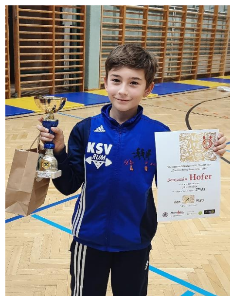
3. Start – 3. Sieg