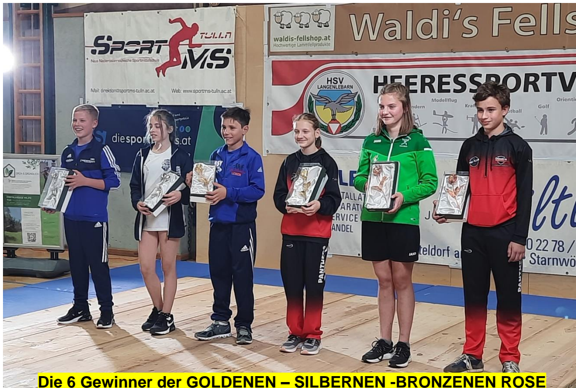
Die 6 Gewinner der GOLDENEN – SILBERNEN -BRONZENEN ROSE