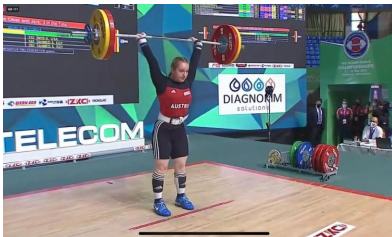
Victoria mit 3-fach Olympiasieger Pyrrhos Dimas und bei 104 kg Stoßen auf der WM-Bühne