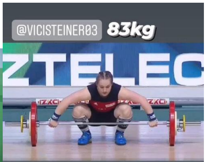
ein paar Bilder von der erfolgreichen U-20-WM von Victoria mit Mama und Papa